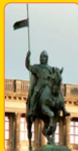
BLAŽOVICE 28. 9. 2018