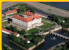
HOLIČ 8. 9. 2018